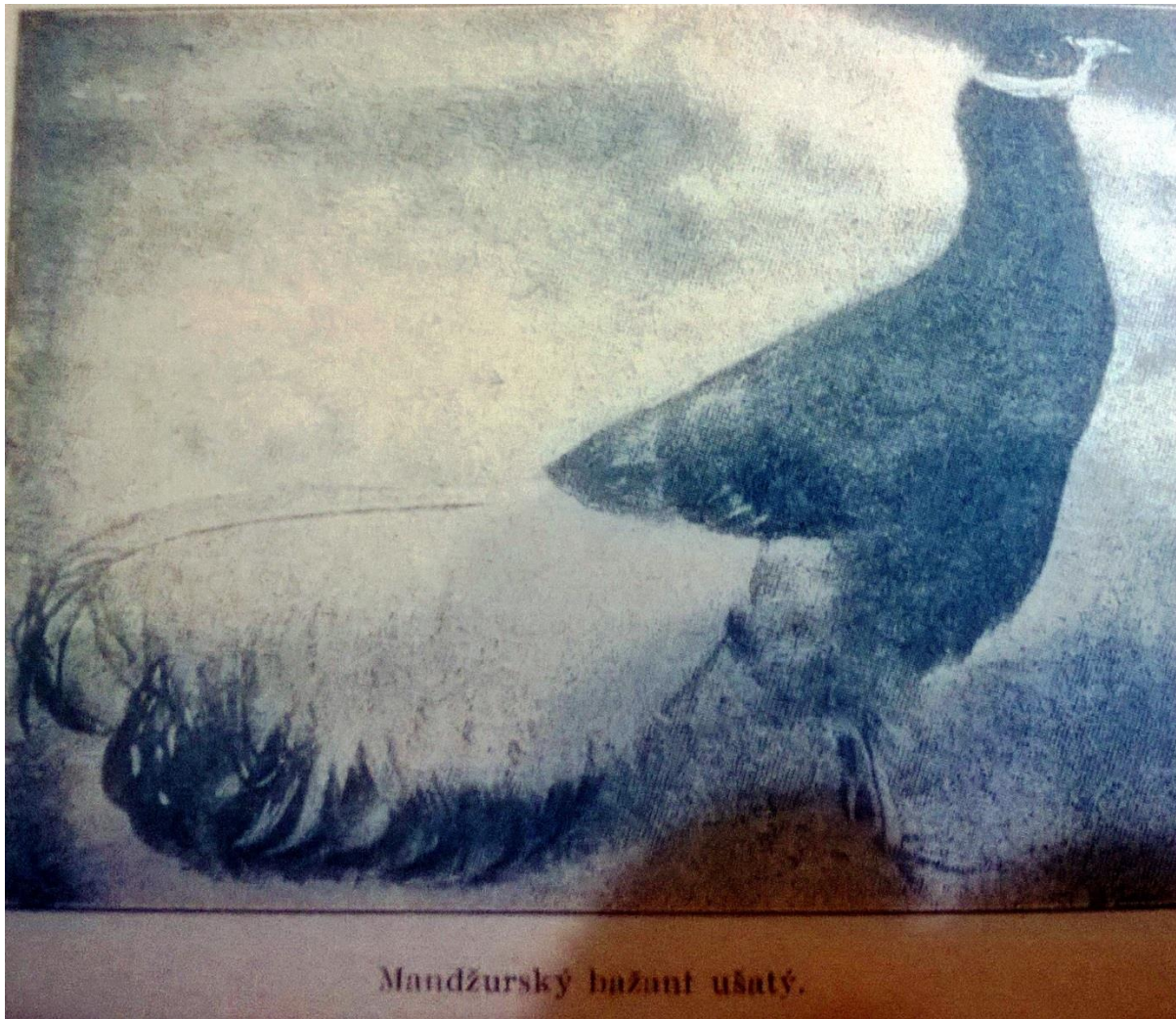
Mandžurský bažant ušatý.

Následující druh ptáků jsou t. zv. Bažanti lesklí. Ptáci tyto jsou ze všech bažantovitých nepopíratelně nejpestřejšího zbarvení.