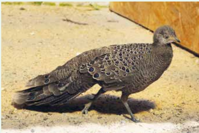
Bažant paví šedý