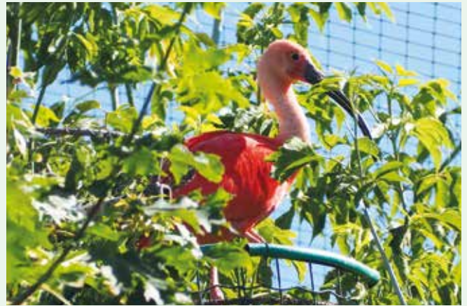
Vysoko u stropu voliéry hnízdí ibisové rudí

Surikaty se nám konečně taky povedly. Loni se nedařily a pak tady byl někdo z brněnské zoo, slušný pán, tak mi to neřekl, ale někde jsem pak slyšel: „Má je tlusté jako prase, tak to nikdy mladé mít nebudou.“ J Tak jsem jim dal dietu a hned máme mláďata.