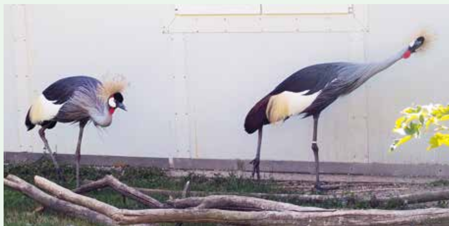
Pár jeřábů korunkatých

Z malých savců jsem viděl i surikaty – snad i s mláďaty?