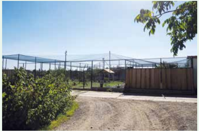
Pohled na část chovného zařízení