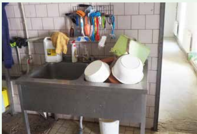
Pohled do zázemí