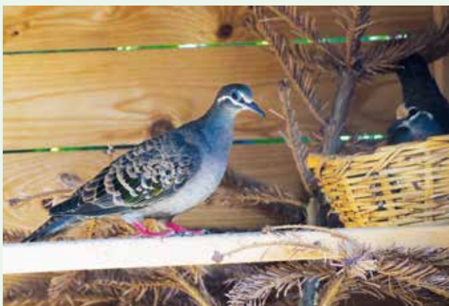
Hnízdící pár holubů bronzovokřídých

Povedlo se mi získat docela dobrý zdroj a vše nyní stavím z PUR panelů, sháním i ten výměťový, když jim zbyde nařezaný, naučili jsme se to řezat, dneska potřebují klempíře, kteří to pospojují, ale stojí to pak léta. Vše to je PUR panel 10 cm široký. A okna podobně, když přijedeš do firmy a popíšeš jim, co chceš, tak tě přivedou do skladu, kde je spousta neprodaných,