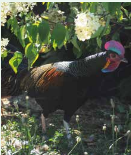
Kohout kura zeleného

Já jsem vlastně panelákové dítě, nepocházím úplně z venkova, i když jsem od malička jezdil k babičce a všechny víkendy a prázdniny jsem byl tady v Nehvizdách. Ale nějaký vztah tu musí být, asi to musí být genetika, protože dědeček byl velký sedlák a po revoluci mi pole vrátili. U nás se říká taková historka, že když mi byly čtyři roky, tak jsem babičce nabízel za čtyři kačenky televizi. Ale jinak jsem choval všechno možné, v paneláku jsem začal s křečkami. První byl křeček syrský, měl jsem několikrát mladé a nevěděl jsem, co s tím, tak jsem je dával v Praze do akvaristiky a prodával je tam za 7 korun. To byly moje začátky. A pak jsem dostal po babičce velký statek, ale v hrozném stavu, jak to tak bývalo. Nejdřív jsem udělal voliéry, se ženou jsme bydleli v rozbitém baráku, ale hlavně že jsem měl voliéry. Pak