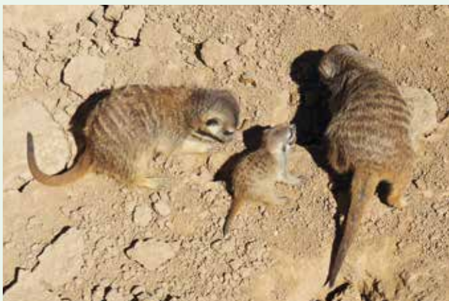
Surikaty s mládětem