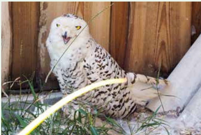
Hnízdící sovice sněžná