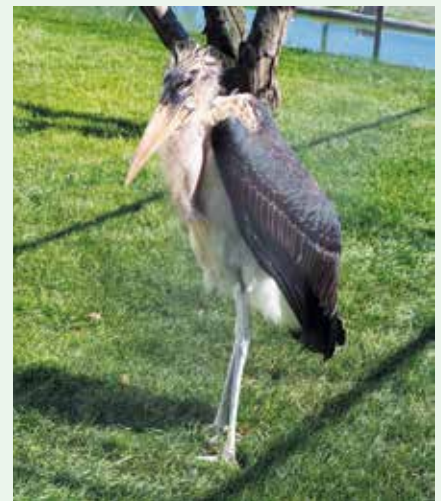
Mladý samec marabu

Ne, to je zajímavé, že ten argus na to, že je veliký, je absolutní klidáš. Ty pralesní druhy jsou obecně takové „bambulovité“,