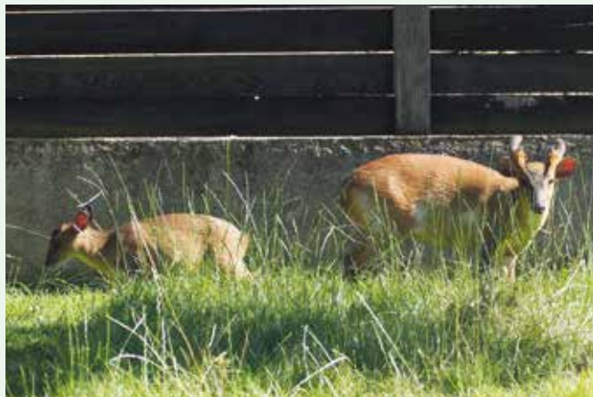
Mundžak s mládětem

zelený, ovoce, mrkev (tu dáváme v podstatě celý rok).