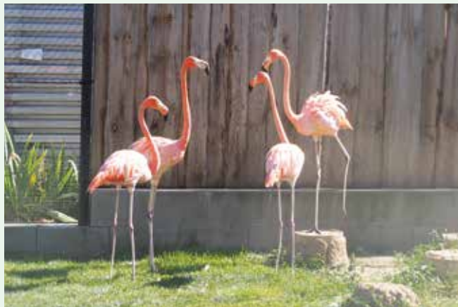
Skupinka plameňáků karibských