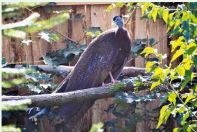
Bažant argus okatý v obrovské voliře

nevyzvednutých oken, vrácených oken a dají ti je za „nákupku“. Díky tomu ty domečky nestojí takové peníze. A u tebe jsem očíhнул ty sálavé topné panely, nevěřil jsem tomu, že to vytopí, ale opravdu ano. Takže ta wattáž není tak hrozná. To znamená, že za ty roky, co stavím z PUR panelů, už to mám vyzkoušené... všechny ty termostaty, hydrostaty, odsávám vlhkost. Principiálně jsou ale stavby z panelů dobré.