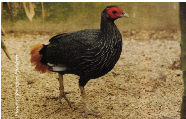
Lophura erythrophthalma pyronota kohout

Bažant červenolící Lophura erythrophthalma a jeho poddruhy se vyskytují v Malajsii, Indonésii a na Borneu. Poslední zprávy o výskytu na Borneu hovoří o rozšíření vzácném a lokalizovaném. V červeném seznamu IUCN je tento druh zařazen jako zranitelný. V současnosti je nejvíce ohrožován ničením a fragmentací jeho životního prostředí za účelem komerční těžby a získávání půdy pro plantáže. Díky zájmu a blízké spolupráci chovatelů z European Conservation Breeding Group (ECBG) vznikla ve Velké Británii nová chovatelská skupina bažanta červenolícího Lophura erythrophthalma pyronota .