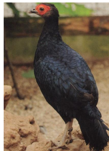
L. e. pyronota slepice