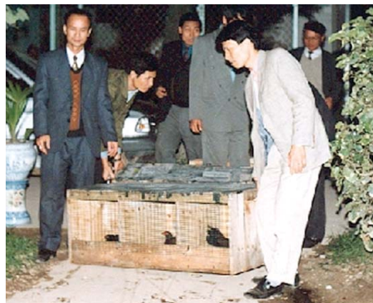
Unikátní fotografie, vlevo kohout bažanta Edwardsova chycený v přírodě v roce 1997 a chovaný po mnoho let v zoo v Hanoji. Vpravo stěhování čtyř párů bažanta Edwardsova z Velké Británie do hanojské zoo v roce 1994.