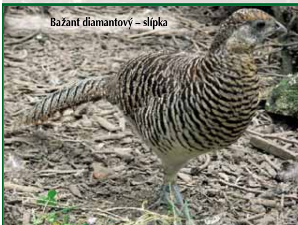
Bažant diamantový – slípka

dé oko, na rozdíl od kohoutů, kterým začíná světlat). Na začátku týla má úzkou červenou chocholku. Na krku pak sněhobílý límeč dvojitě příčně černě lemovaný. Tento v toku rozevívá. Břicho a boky má opět sněhobílé, peří na nohou může být černé, ale nikdy hnědé nebo červené. Křídla tmavě modrá. Nohy jsou vyšší, břidlicové barvy. Žlutý hřbet přechází v oranžový kostřec, který pokračuje v ocas. Střední pero ve tvaru obráceného V je stříbřitě bílé a široce černě příčně pruhované, mezi pruhy je pak jemné černé žíhání. Délka ocasu by měla dosahovat 100–110 cm, celková délka je 150–170 cm, váha okolo 700 g.