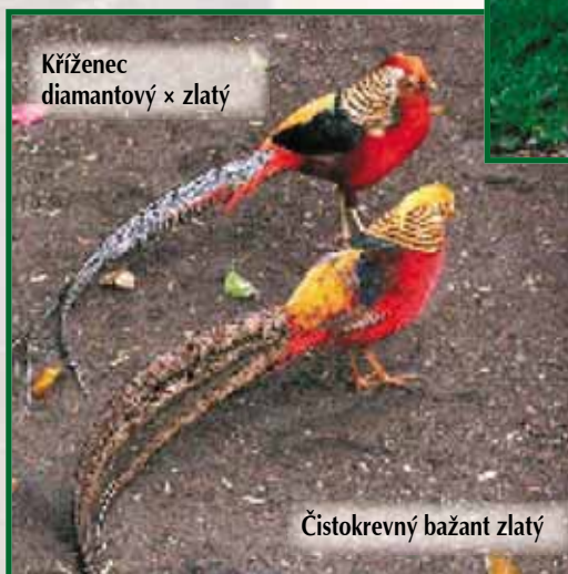
Kříženec diamantový x zlatý