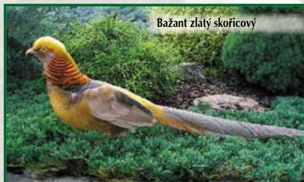
Bažant zlatý skořicový

Skořicový je podobný bažantu zlatému žluté- mu, břicho a hrud' má hnědoskořicovou barvu, ocas je proužkovaný a ne mramorovaný. Slípka je o něco tmavší než zlatá žlutá, s výraznější kresbou.