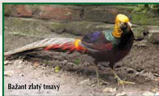
Bažant zlatý tmavý

Slípka je tmavě kakaově hnědá se stejnou kresbou jako nominální poddruh. Oko tmavé.