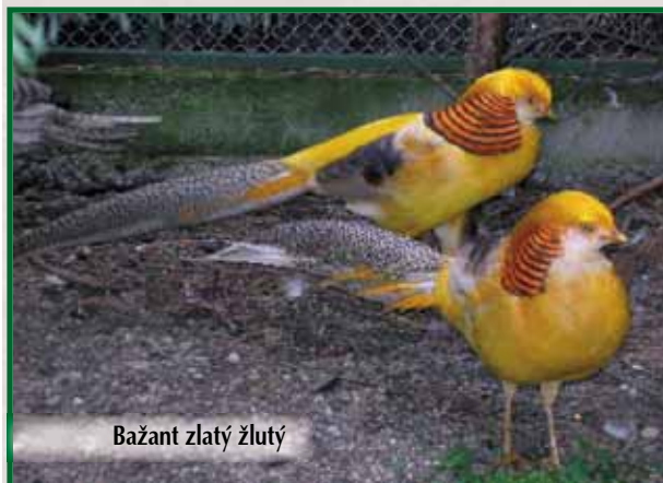
Bažant zlatý žlutý

Kohout má límeček a chocholku stejné barvy jako nominální poddruh, břicho, hrud' a záda včetně kostřece stejné barvy jako chocholka, bradu a tváře má šedobílé, záda pod límcem