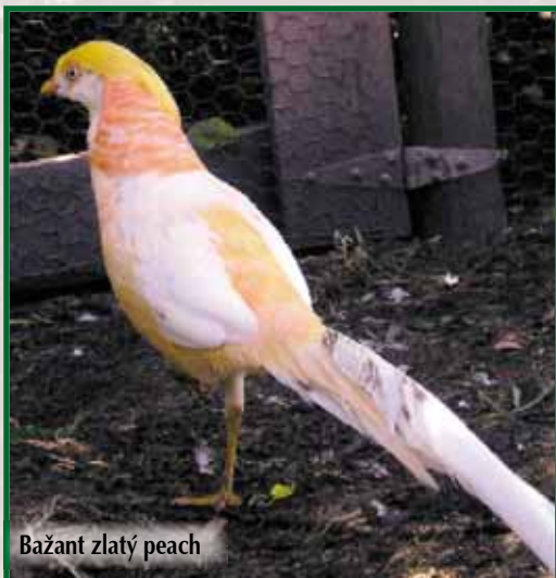
Bažant zlatý peach