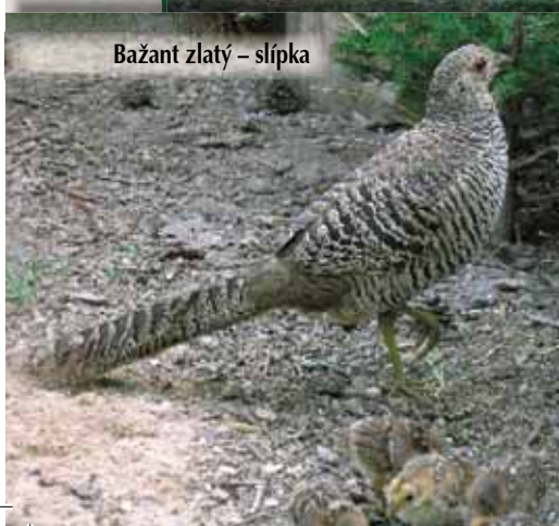
Bažant zlatý – slípka

Kohout dosahuje délky až 110 cm, přičemž 60–70 cm připadá na ocas, a váží okolo 600 g. Na hlavě má lesklou velkou chocholku žluté